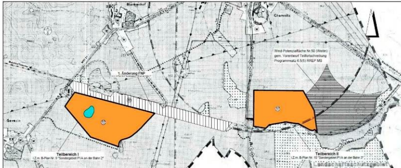
Anlage: 2. Änderung des Flächennutzungsplanes (Auszug aus Beteiligungsunterlagen)